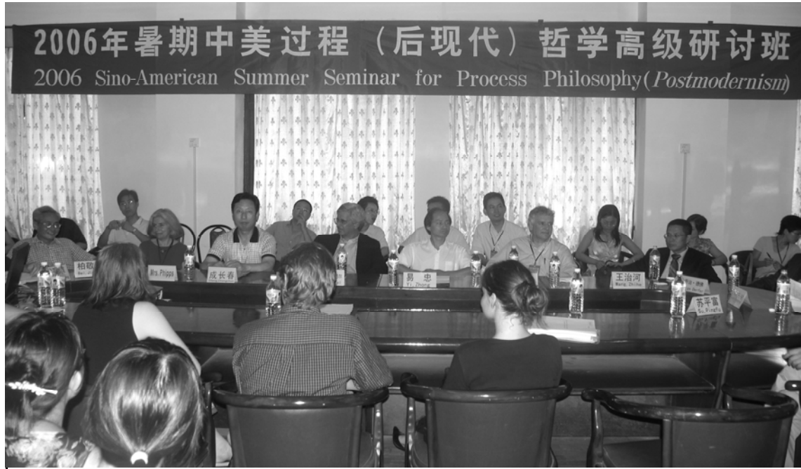
2006年暑期中美過程（後現代）哲學高級研討班 2006 Sino-American Summer Seminar for Process Philosophy (Postmodernism)

當代著名猶太哲學家馬丁·布伯曾經說過：“一切真實的人生皆是相遇。”今年夏天在桂林參加的由美國克萊蒙特過程研究中心及廣西師範大學聯合開辦的“2006年中美過程（後現代）哲學暑期高級研討班”，是對這句話很好的印證，這次人生的經歷可以說是不斷相遇的過程，而且是一次次美麗的相遇。