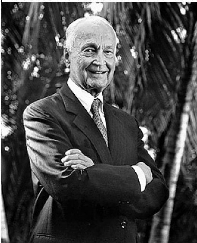
全球投资之王汤普敦爵士（1912—2008） (Sir John Mark Templeton)

拜改革开放之赐，中国富豪的产量也多了起来。这不是坏事。但尽管灯红酒绿，香车宝马，“中国富人活的不快乐”也是一个有目共睹的事实。象条“时刻担心被捕捞的鱼”，中国的富人其实过的很不爽。所谓湖润的中国富豪排行榜，几近“逮捕榜”。几乎露头一个，栽一个。这就需要下点反思的工夫了。将板子完全打到社会的“仇富”心理，显然有失公允，应该扪心自问一句：我为社会和穷人做了点什么？