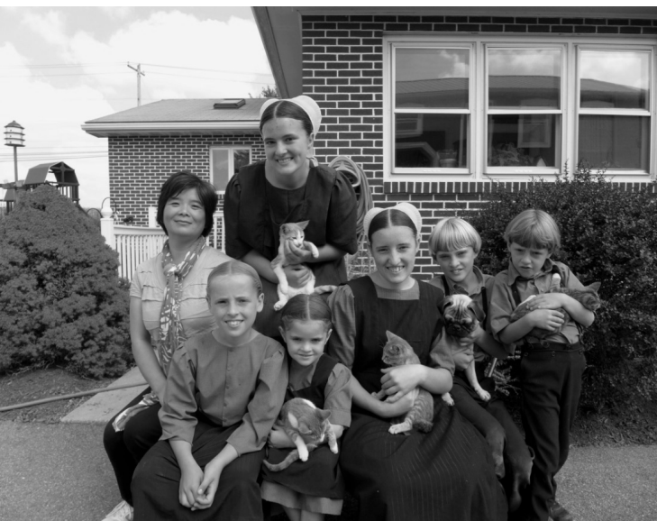
笔者与亚伯家子女们在一起

如果像我这样的十多岁女孩,喜欢耳环、项链、纹身、戴手镯的话,那么,我的心就不安稳了,我将不会知足。兄弟们都和父母在平时习惯于身穿吊带长裤、头戴草帽;我们姐妹们和母亲习惯穿棕色、蓝色或者黑色的长裙,外出时则系上围巾戴上白帽。这都是妈妈和姐姐教我们做的,不用花很多钱,穿上也很舒服合体。至于头发,是上帝给的,无论是黑的、灰的、金黄色或者白色,都是自然的。现在有人不以自然为美,将头发染烫,于是出现了赚钱的理发店,这就走上了邪路。父母也教导我们,不能喜欢拍照,因为容貌是上帝赐予的,是外在的,